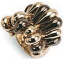
Ring med chokoladefarvet pink guld og pink guld, til 30.375 kr. Fotograf: Monique Bernaz.

Armbånd med tre dråber chokoladebrunt guld og tre dråber besat med brune diamanter (i alt 2,80 carat), det andet armbånd med tre gyldne gulldråber og tre dråber besat med 194 hvide diamanter (i alt 6,40 carat) til 58.875 kroner og 78.375 kroner. Fotograf: Monique Bernaz