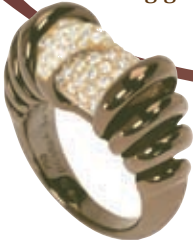
Ring med chokoladefarvet brunt guld og 151 hvide diamanter (i alt 1.75 carat), til 87.000 kr.

Det er kurmageriets ældste spørgsmål: Chokolade eller smykker? Men hvordan skal mændene kunne vælge? Kvinder vil i reglen gerne have begge dele! Tre store smykkefirmaer kombinerer det bedste med det bedste i perfekte gaver – chokoladefarvede juveler. Da farven brun ikke altid lyder så appetitvækkende, er den siden 1990'erne blevet markedsført som chokolade, kaffe eller cognac – alt afhængig af lød og tone.