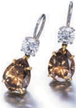
Fra Harry Winston: Dybe orangebrune pæreformede øringer på hhv. 3.65 carat og 3.20 carat, to hvide brillanter, fattet i platin og 18 karat guld, til 385.000 kr.