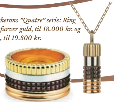
Fra Bouchérons "Quatre" serie: Ring med fire farver guld, til 18.000 kr. og vedhæng, til 19.800 kr.