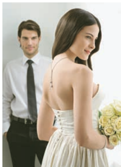
Antal vielser og skilsmisser

I en tid, hvor alting går stærkt, og hvor fokuset på selvet, den enkeltes udvikling og behov er enormt, er det ganske enkelt bare lettere at se frem til at overstå de første syv år, end til kobberbrylluppets 12½. Herhjemme fortæller statistikkerne da også, at de første seks-syv år er afgørende. For et par viet i den gennemsnitlige alder topper antallet af skilsmisser nemlig markant efter seks-syv års ægteskab, hvorefter det falder igen. Måske er der derfor større sandsynlighed for, at vi fremover fejrer sukkerbryllup (seks år), uldbryllup (syv år) eller bronzebryllup (otte år). Selvfølgelig stadig med en markering af kobberbryl-