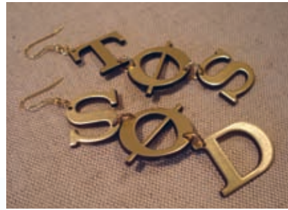
Rie Winklers koncept-smykker fra kollektionen "Jack of all Arts".