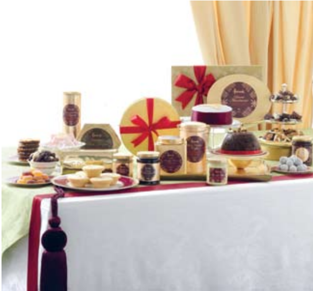
Harrods Eaton julekurv.