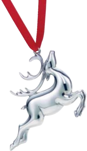
Tiffany & Co.s julepynt i sterling sølv.