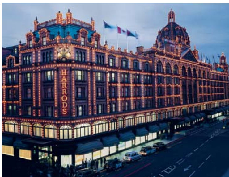
Et julepyntet Harrods i Knightsbridge.

Naturligvis sælger Harrods også håndlavede juleknallerter med små sølvgaver indeni – traditionelt udseende, victoriansk inspirerede og nogle mere moderne.