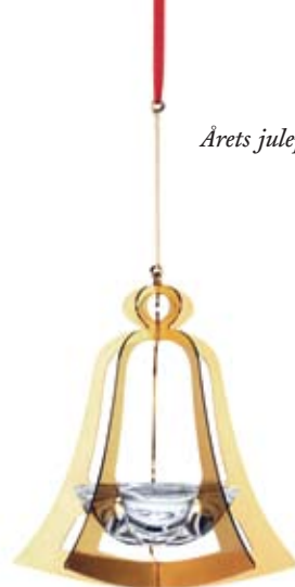
Årets julepynt fra Holmegaard.