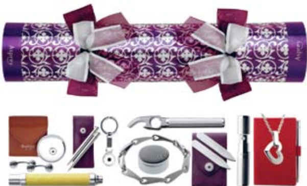
Aspreys fyld til den klassiske knallert.

Sammen med Harrods, står Asprey for de ærkebritiske juletraditioner, solidt forankret i det engelske samfund. Asprey blev grundlagt i 1781, dengang da det britiske imperium havde kolonier på næsten samtlige kontinenter. Kun det bedste blev sendt tilbage til England, som til gengæld lærte at sætte pris på det bedste håndværk, som forskellige nationer havde at byde på. En tradition, som vi i Danmark nok mere ville forbinde med nytår, er juleknallerter. Asprey vælger at tilbyde forskelligt ”fyld” – alt fra manchetknapper i sølv til de største diamantringe. Det er op til kunderne selv at fylde knallerterne, og uanset indhold bidrager de til en festlig stemning. Kan købes individuelt, eller i pakker af seks eller tolv. Her ses blandt andet er sølvhjertevedhæng på rød læderkalender, en nøglering, en rejseparfumebeholder, en pilleæske, skjortestivere på lilla læderpung, kuglepen og blyant ved lilla læderpung, og en gul læderindbunden lommelygte. Pris afhængig af indhold.