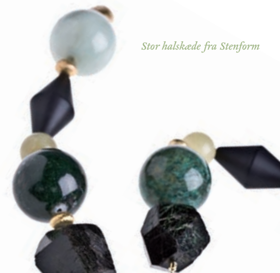
Stor halskæde fra Stenform

Efteråret leverer inspiration til farveskalaens skovfarver med grønne og brune nuancer tilsat brændt orange, gylden brun og limegrøn. I moden lyser de gyldne farver de mørkere toner op. Farverne ligger op til mønstermiks og maskuline detaljer.