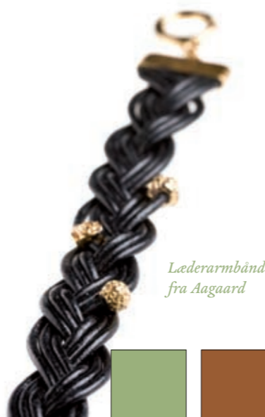
Læderarmbånd fra Aagaard