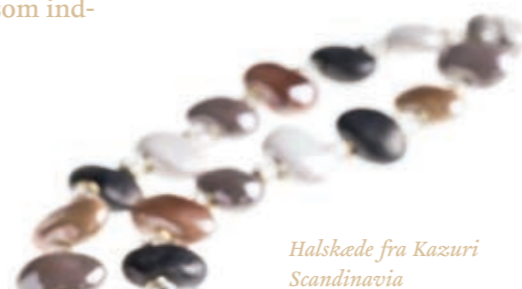
Halskæde fra Kazuri Scandinavia