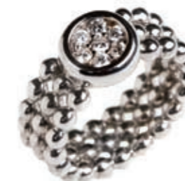
Diamantring fra Ruben Svart