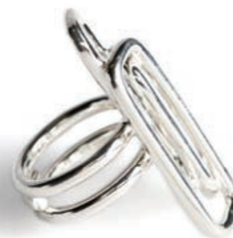
Sølvring fra Heiring

Tænk. Tænk i det blå univers af intellektualitet, tryghed, fordybelse og eftertænksomhed. Tænk i et nyt, afrundet designsprog til fremtidens design med arkitekt Zaha Hadid som frontfigur. Tænk i ny teknologi og intelligente designløsninger. Tænk i naturlige, men kølige materialer som marmor og granit i nye, moderne sammenhænge. Tænk i et klassisk look med avancerede detaljer. Tænk i rene linier og glatte overflader. Tænk på fremtidens design.