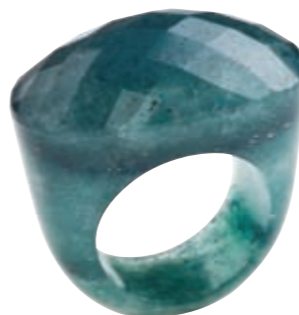
Mitos ring af amazonit

Discover går på opdagelse i et maskulint univers. Det er ingen kønsrolleforvirring og den ægte maskulinitet blomstrer. Opdag den nye, over-seksuelle mand med idealet Bono i spidsen eller den maskuline naturnørd, som er en ægte naturelsker. Genopdag aktiviteter som jagt, spejder, vandring og friluftsliv som inspiration til temaet. Discover handler om maskuline materialer som læder, oilskin, uld, fløj og strik, og discover søger tilbage til håndværkstraditioner på en ny raffineret måde. Discover er over-maskulin og genopdager den rigtige mand.