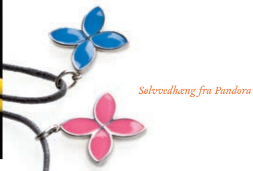
Sølvvedhæng fra Pandora

Leg. Play handler om leg på alle niveauer. Leg med identiteter i et iscenesat, kunstnerisk udtryk inspireret af Jeff Koons eller David Chapelle. Leg med rene linier og mange farver. Leg med kontrastfarver, der kræver opmærksomhed. Leg med stærke farver til detaljen i et ellers mørkt look. Leg med farverige prints inspireret af den gamle digitale verden. Leg med en ung, humoristisk attitude. Just play!