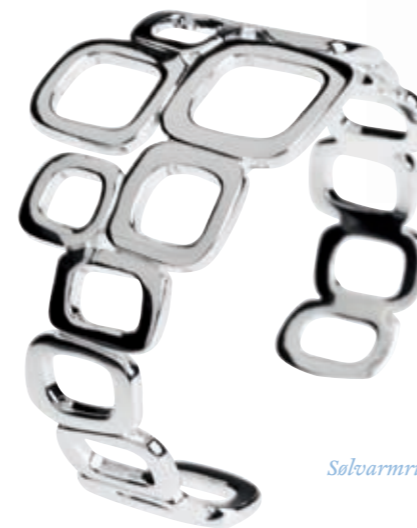
Sølvring fra Støvring

80'er- og 90'er-kombinationer, overdrevne proportioner, stofknapper, arkitektonisk silhuet, dobbeltknappet, blålige toner i tonede nuancer, klassiske styles med enkelt twist, fokus på skuldre, glatte overflader, skrædderteknikker, autoritære styles, smalle bæltter, high tech accessories og formel elegance.