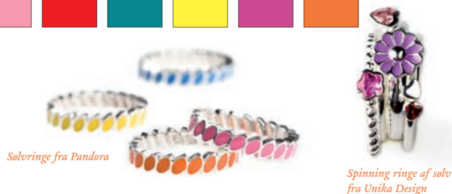
Sølvringe fra Pandora