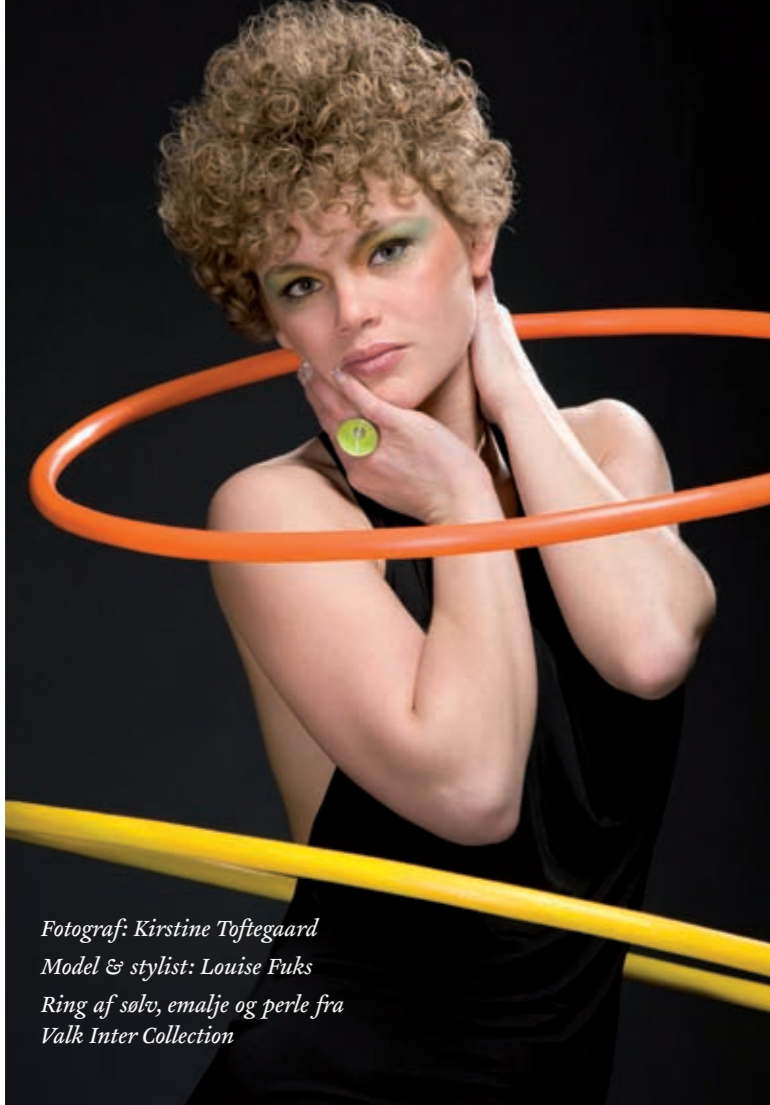
Model & stylist: Louise Fuks Ring af sølv, emalje og perle fra Valk Inter Collection