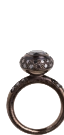
Sort rhodineret sølvring med sorte diamanter (3,36 carat) fra Romild