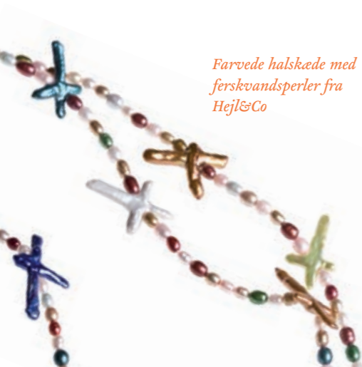
Farvede halskæde med ferskvandsperler fra Hejl&Co

Leg med stærke farver som orange, gul, pink, oceanblå, postkasse-rød og rosa pink tilsat basisfarver som sort, mørkegrå og blækblå. I moden sammensættes farverne i enten multifarvede kombinationer med op til fem farver eller anvendes som detaljefarver til store flader af sort, grå eller blå.