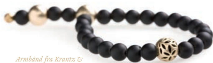
Armbånd fra Krantz & Ziegler i sort agat med mat 14 karat guldlås og to pyntekugler i mat 14 karat guld

Føl feminiteten. Oplev æstetisk forførelse via bløde, strukturerede overflader, der indbyder til at blive rørt. Silhuetten er organisk og forførende, mens sorte blonder og eksklusiv guld skruer op for dekadencen. Det giver samtidig et nyt look og skaber en feminin moderne stil. Inspiration hentes fra datidens feminine, forførende og klassiske Audrey Hepburn-stil med Carla Bruni-Sarkozy som nutidens repræsentant. Feel er et klassisk univers krydret med diskrete, eksklusive detaljer, som indbyder til at gå tættere på.