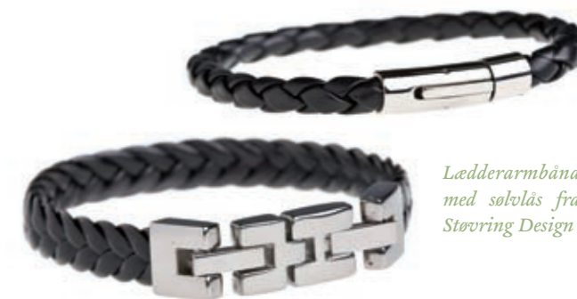
Læderarmbånd med sølvslås fra Støvring Design

Pelskanter, rå natur, fuldskæg, afskårne bukser, tern, strik med mønstre og motiver, fløj, ræven som motiv, spejder-detajler, udendørsinspiration, slettens farver, læder og stof kombination, maskuline damestyles, strik med frynser, kraftige lag, fodformede sko, læder finish og grove detaljer.