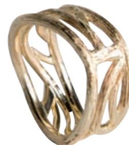
Guldring fra Nuran (I.S. Design)