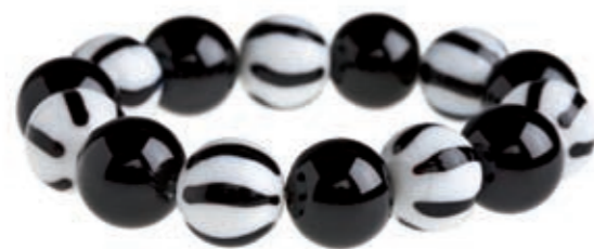
Armbånd fra Hejl&Co