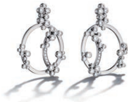
De klassiske ovale former fra Audemars Piguet's "Millenary Précieuse" smykker