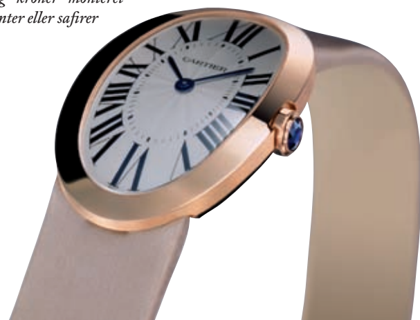
Cartier – Baignoire uret; enkelt design og elegance. Remme af satin, læder, kanvas eller guld, urskiver af guld i forskellige nuancer, og kroner monteret med diamanter eller safirer