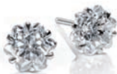
Montblanc diamanrestikker slebet i form af den klassiske logostjerne, på hhv. 2,15 og 2,17 carat

blandt de mest populære. Perlemor (i mange nuancer) blevet brugt i mosaik-teknikker, og så markerede både emaljemaleteri og udskårne sten sig på tværs af mærkernes ure og smykker.