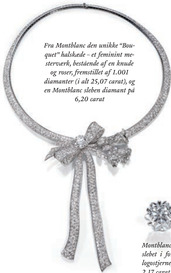
Fra Montblanc den unikke "Bouquet" halskæde – et feminint mesterværk, bestående af en knude og roser, fremstillet af 1.001 diamanter (i alt 25,07 carat), og en Montblanc sleben diamanter på 6,20 carat