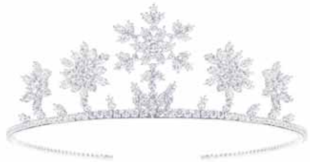
Harry Winston prøver som det eneste firma kræfter med en snefnugtiara: 162 brillanter, 31 pæreformede diamanter, 46 markiseslebne diamanter - i alt 239 diamanter, der tilsammen vejer 34.42 carat, fattet i platin, til 1.43 mio. kr.