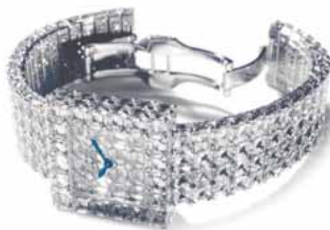
Chopard's ur "Super Ice Cube" i 18 karat hvidguld, sat med 288 firkantede diamanter (57.26 carat) og med 1.897 diamanter i forskellige andre slibninger (i alt 5.68 carat).