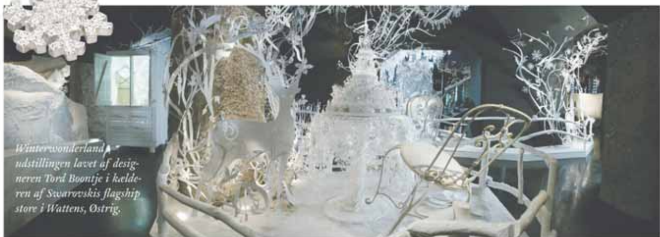
Winterwonderland udstillingen lavet af designeren Tord Boontje i kælderen af Swarovskis flagship store i Wattens, Østrig.