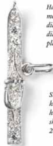
Siden 1906 har Cartier lavet jule-, is- og snefnugsmykker, nærmere betegnet charms og brocher. Her ses en humoristisk Cartier charm fra 1950, der forestiller en ski - af platin og paveret med cirkulære diamanter, 2.3 cm lang. I privat samling.

Hver sæson har sine smykke-sællerter: Til Valentine er det hjerter og røde smykker der løber med opmærksomheden, til påske kan man næsten altid være sikker på, at historien om Fabergés æg får omtale i medierne, og til forsommerens konfirmander er der kors i forskellige udformninger. Så hvad kan man forvente i december måned? AuClock bringer her et ønskebud - med håbet om se det opfyldt næste år.