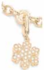
Bulgari tør, som det eneste firma, at anvende gult guld til snefnug motivet – her i en charm besat med diamanter til 16.125 kr.