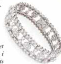
Siden 1946 har Van Cleef & Arpels lavet snefnug-smykker. Her snefnugarmbånd i platin med diamanter, som Julia Roberts havde på, da hun modtog sin Oscar.