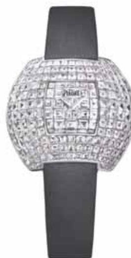
Sneboldeuret fra Piaget: Urkasse af 18 karat hvidguld med 162 baguette slebne diamanter (i alt 15.9 carat), urskive af 18 karat hvidguld med 32 baguette slebne diamanter (i alt 2.4 carat), og et spænde (på den sorte satinrem) af 18 karat hvidguld med 14 baguette slebne diamanter (i alt 1.5 carat). 3.106 mio. kr.