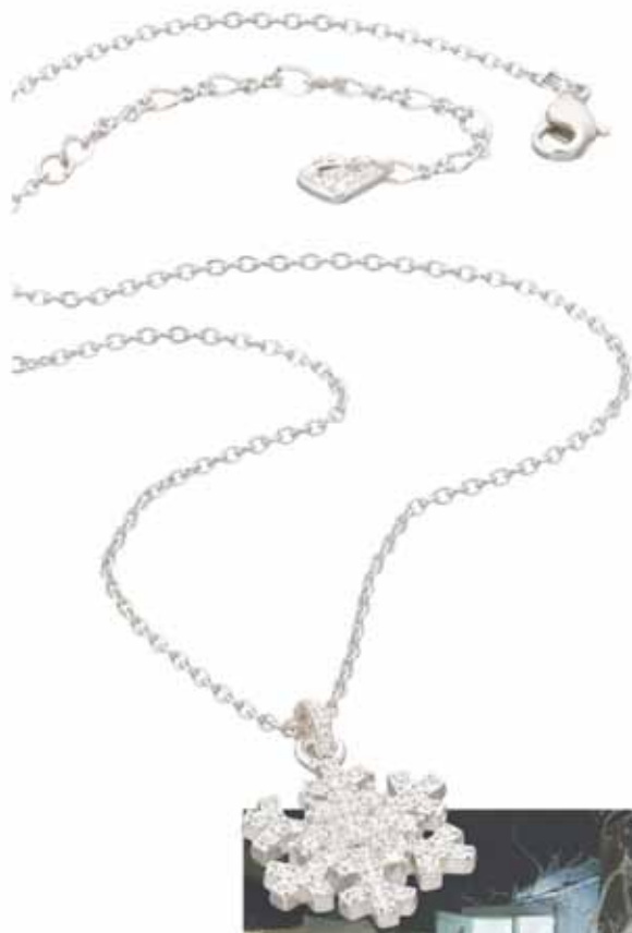
Swarovski vedhæng (430 kr.) med snekrystaller som motiv.