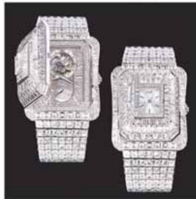
Dobbeltur fra Piaget med 1.144 diamanter (106.52 carat forskelligt slebne diamanter). Solgt til den beskedne pris af 16.95 mio. kr. Det øverste ur er et kvartsværk, uret nedenunder et kompliceret mekanisk urværk. Begge ure er gemt under hemmelige låger, som udløses ved tryk på diamanterne ved 3-tallet.