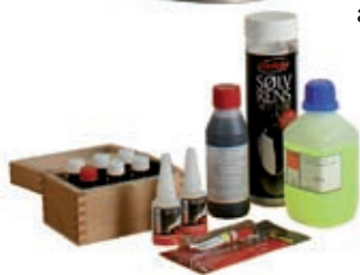
Udsugning fra Røstvedhus

Rensning af ure er set foretaget med sprit i stedet for rensbenzin. Citronsyre ses brugt til at rense en lodning i stedet for svovlsyre. Rensning af smykker foretages mange steder i ultralydsbade, som blot er tilsat sæbevand.